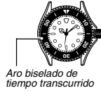
Aro biselado de tiempo transcurrido