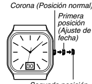
Corona (Posición normal)